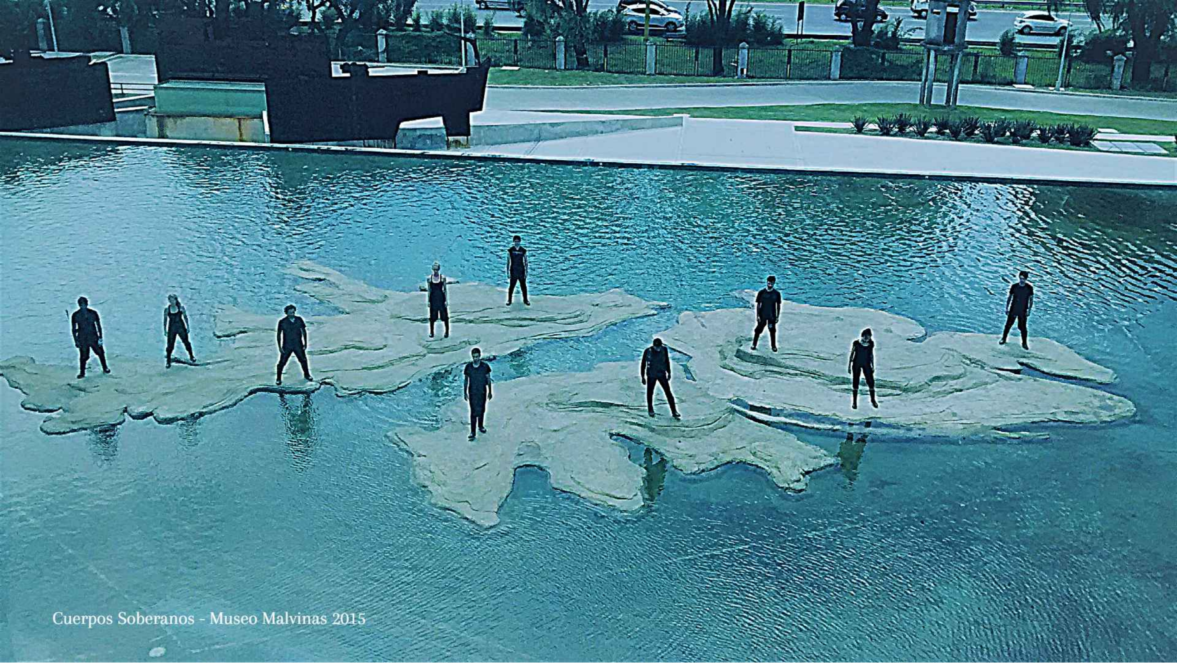
Cuerpos Soberanos - Museo Malvinas 2015