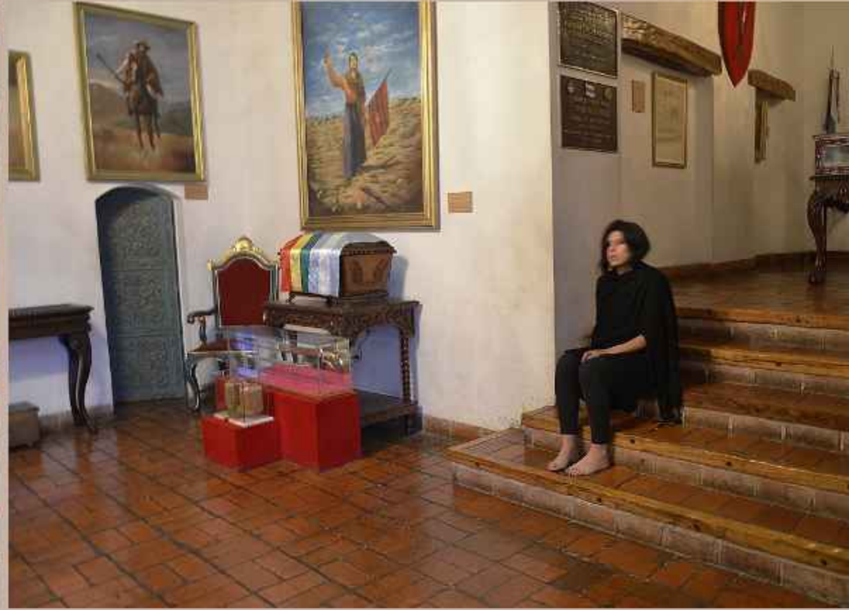
Lo que cuentan las paredes Museo Casa de la Libertad Antigua Universidad de Chuquisaca Sucre - 2016