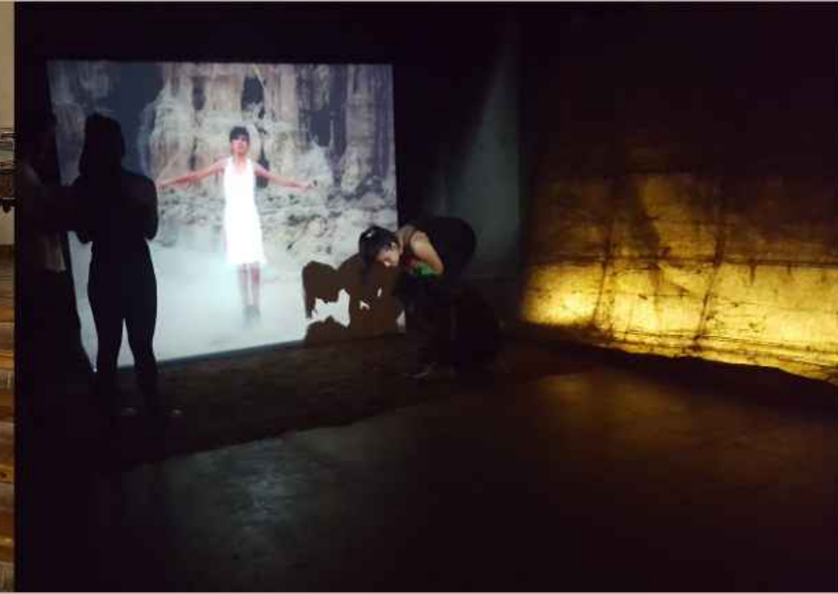
Cuerpos Cartográficos Centro de la Cultura Plurinacional Santa Cruz de la Sierra - 2016

Los Museos son la memoria de la humanidad. Una memoria legitimada. Una mirada, un fragmento, lo que se quiere mostrar, un relato.