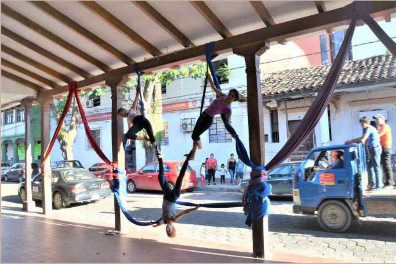
Muros y Memorias Casa Histórica Feliciano Rodríguez Santa Cruz de la Sierra - 2017