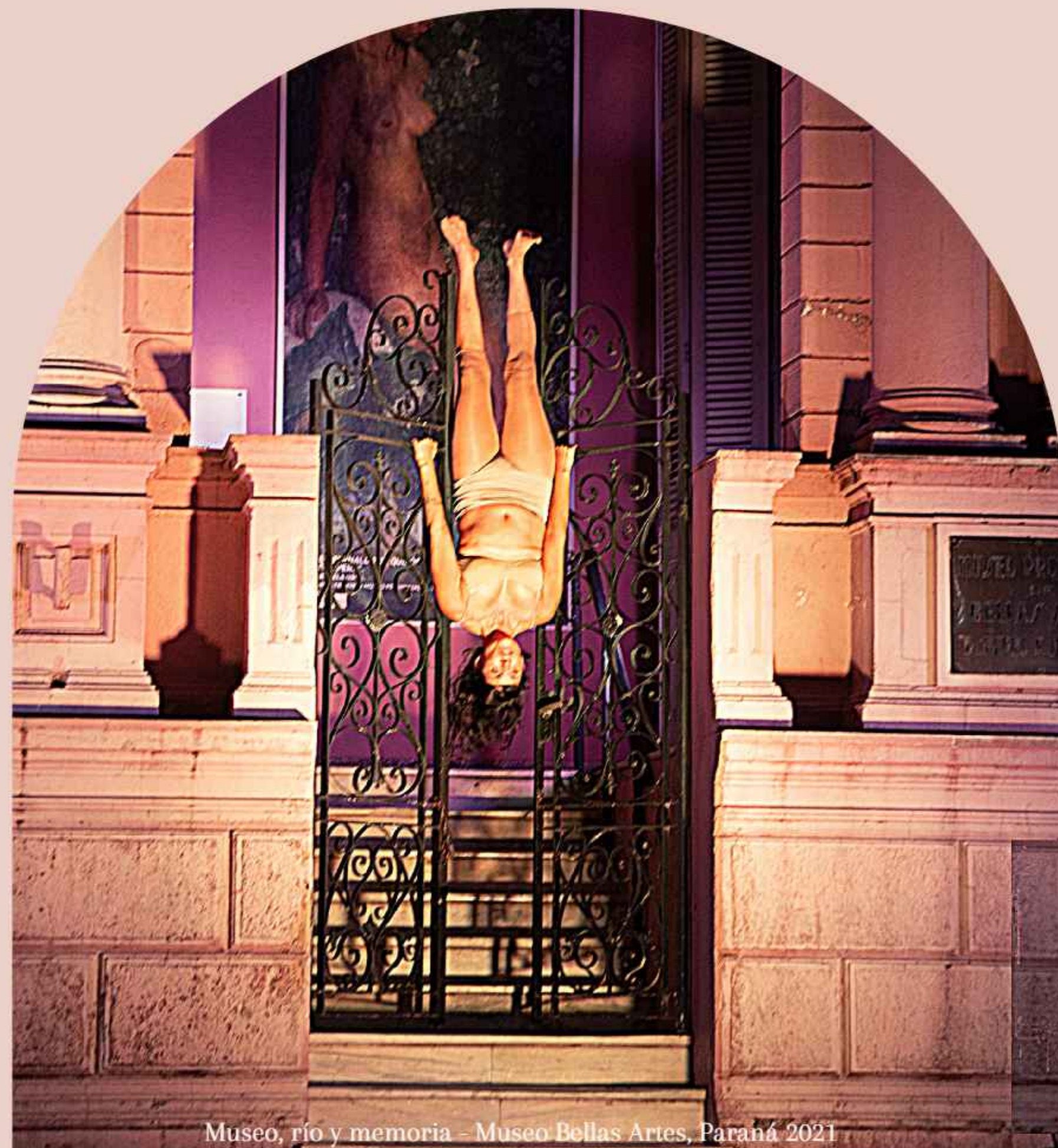
Museo, río y memoria - Museo Bellas Artes, Paraná 2021

No se trata de verticalizar el proceso creativo ni de “colonizar” artísticamente un espacio, si no de resaltar las particularidades de cada contexto desde una mirada contemporánea, generar un ámbito de creación conjunta y plural a partir del intercambio sensible de saberes y recursos.