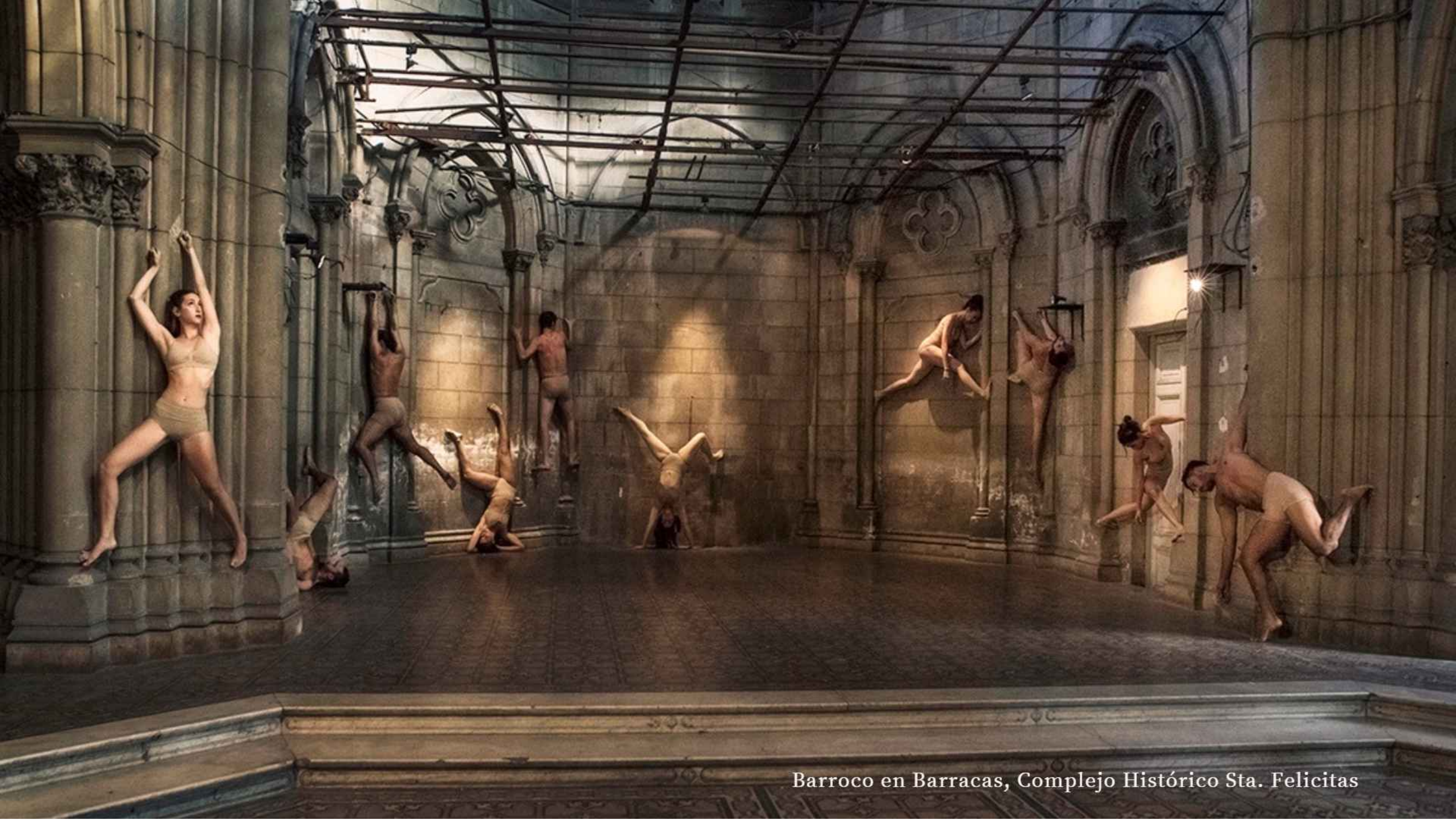
Barroco en Barracas, Complejo Histórico Sta. Felicitas