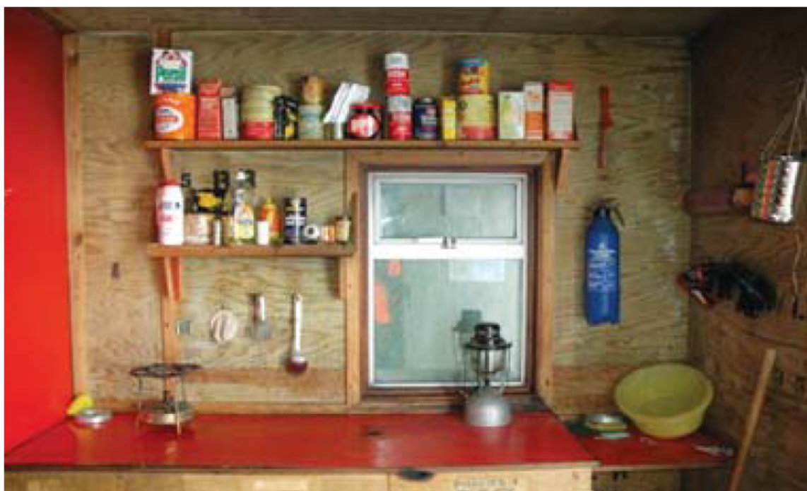
Interior de la cabaña Damoy, Sitio y Monumento Histórico No 84

*Se entiende por buque una embarcación de más de 12 pasajeros.