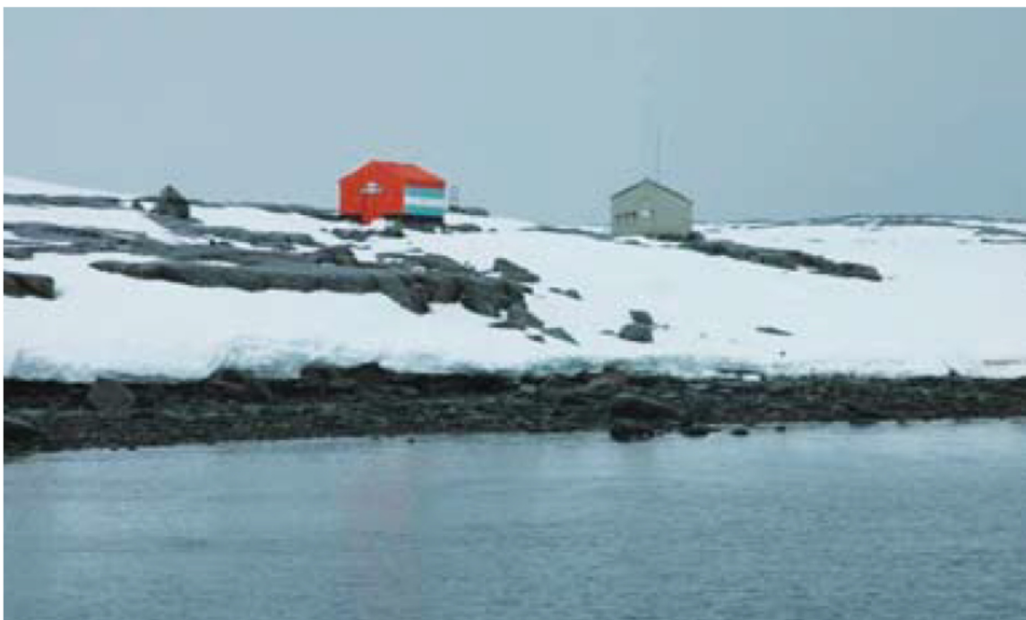
Costa de la bahía Dorian, con el lugar de desembarco preferido y las cabañas argentina y británica en el fondo

*Se entiende por buque una embarcación de más de 12 pasajeros.