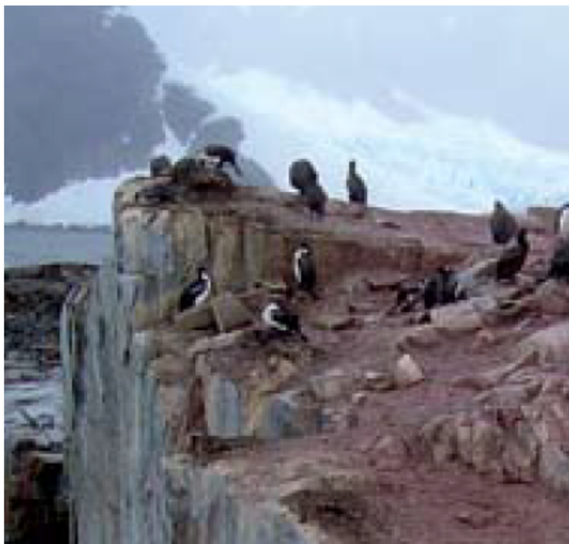
Cormoranes imperiales en las inmediaciones del filón basáltico (nordeste de la isla Petermann)

*Se entiende por buque una embarcación de más de 12 pasajeros.