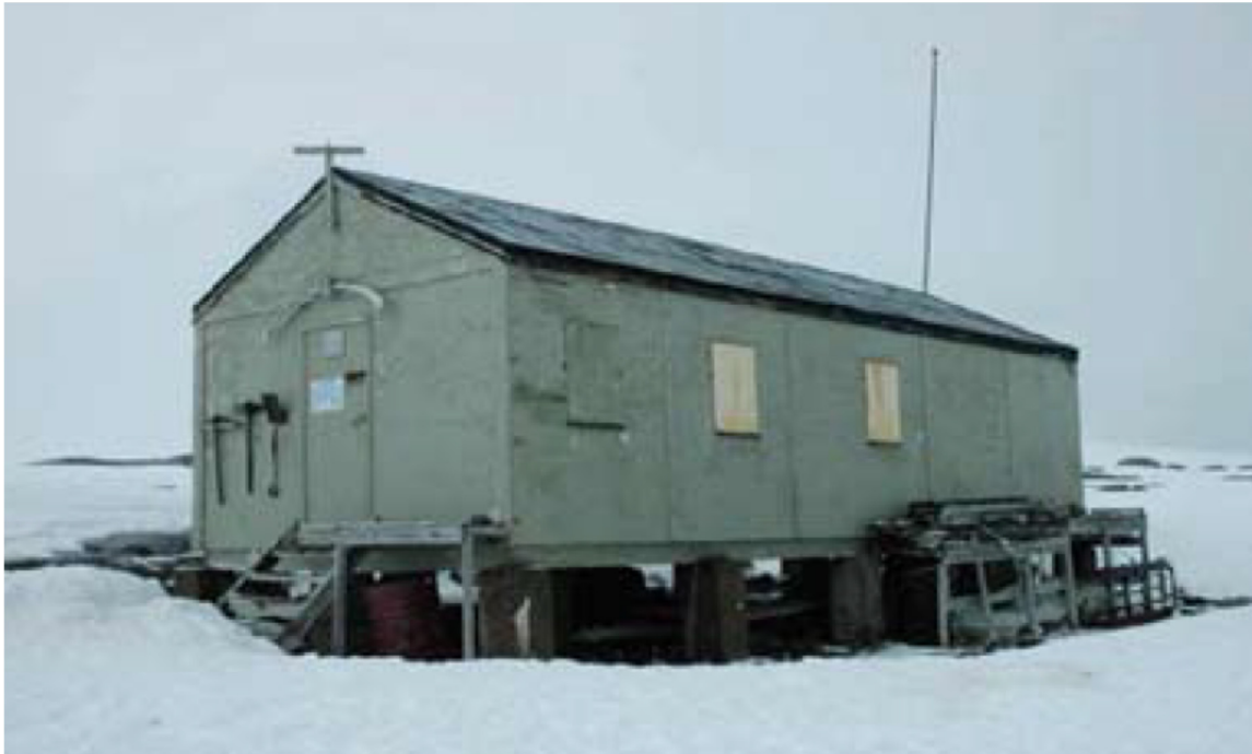
Cabaña Damoy (Reino Unido), Sitio y Monumento Histórico No 84