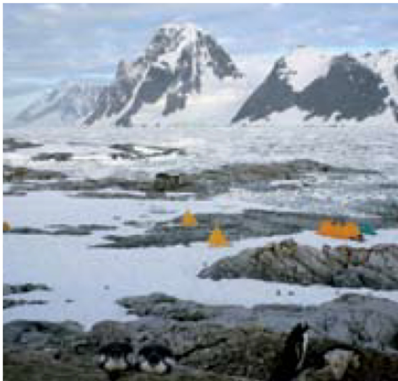
Isla Petermann - Cabaña de refugio, objetos históricos y actividades científicas